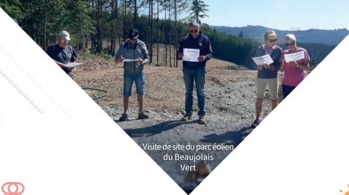
Visite de site du parc éolien du Beaujolais Vert